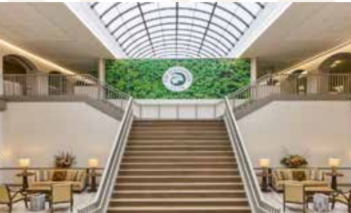
Houstonian Club, Houston, USA

Als Mitglied des Berlin Capital Club haben Sie die Möglichkeit, fast 250 exklusive Stadt-, Sport-, Country- und Golfclubs gegen Vorlage Ihrer persönlichen IAC-Karte oder IAC-App weltweit zu nutzen. So bieten Ihnen die renommierten Clubs in vielen internationalen Metropolen ein „Home away from Home“.