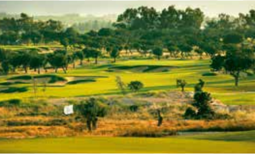
Elea Golf Club, Paphos, Zypern